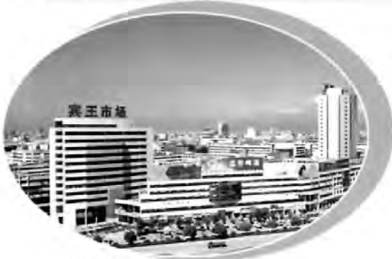
▲中国日用雑貨城賓王市場

1995年11月、中国日用雑貨城賓王市場を作り上げました。市場の敷地面積は約209ムーで、主に服装、メリヤスの下着、ネクタイ、毛糸、タオル、皮革、織物、レース、寝具、副食、ドライ・フルーツ、キャンディ、炒ったもの、雑貨、出版物など16種類の業界の商品を経営します。