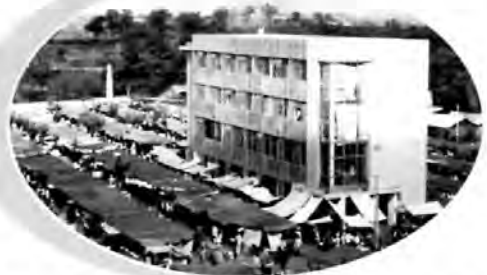
▲1984年第2代義烏日用雑貨市場

1984年末、セメント床を市にし、セメント板を出店場所にし、瓦棚を頂にし、「麦黨帽子の市場」と呼ばれている第2代市場が開業しました。市場の出店場所の総計は2847個まで達し、輻射範囲は周辺の県市から省内外まで延びます。