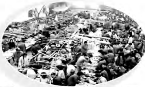
▲1982年第1代義烏日用雑貨市場

1982年8月、粗末な義烏第1代日用雑貨市場は誕生しました。市場は道を市にし、木板を出店場所に、「大通り市場」と称されます。