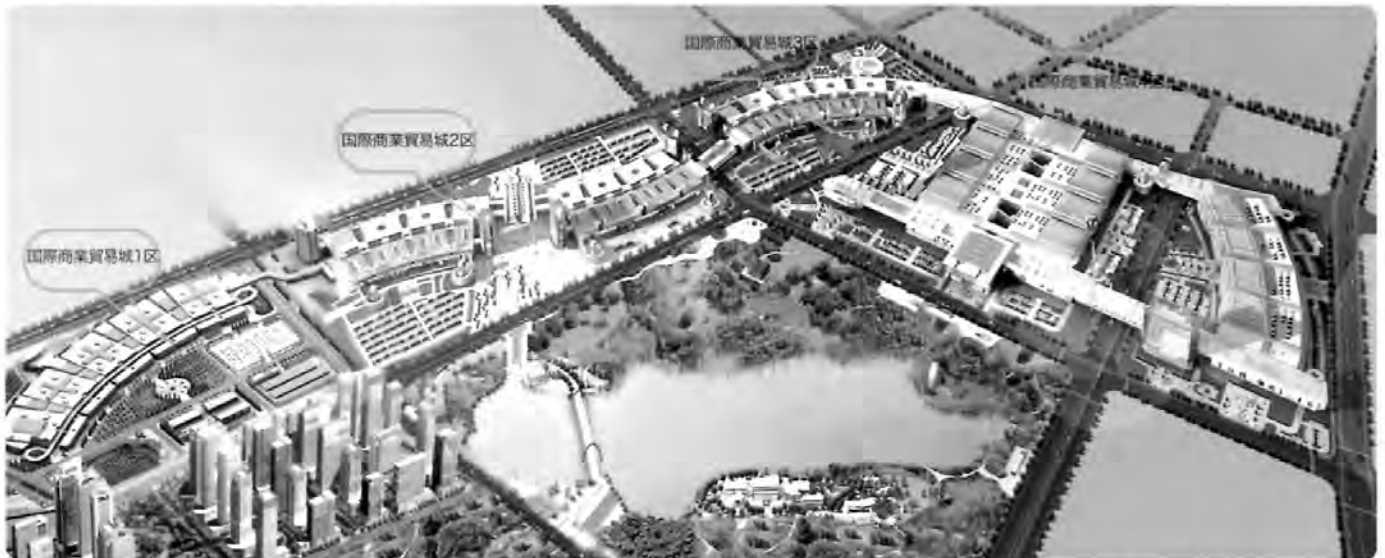
義烏国際商業貿易城全景図

義烏は中国浙江省の中心部にあり、中国最大の都市・上海から300キロメートルで、浙江省都・杭州市から120キロメートルです。義烏中国日用雑貨城は国際日用雑貨流通、情報、展示センターで、中国最大の日用雑貨の輸出基地の1つです。2005年に国連、世界銀行とモルガン・スタンレーなど権威機関に「全世界最大の日用雑貨の卸売市場」と評価されます。2009年に中国の日用雑貨城における市場の取引高は411.6億元で、19年連続全国各専門市場の首位にランクされます。