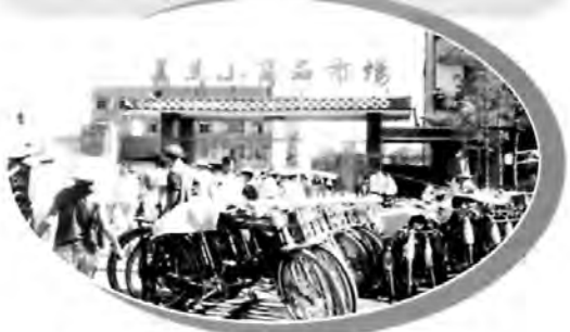
▲1986年新馬路日用雑貨市場

大規模な自由市場を作り上げました。市場の敷地面積は44000平方メートルで、増築することによって、1990年末までに全国最大の日用雑貨の専門卸売市場になりました。