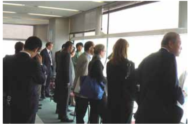
WTCから大阪湾を俯瞰する参加者