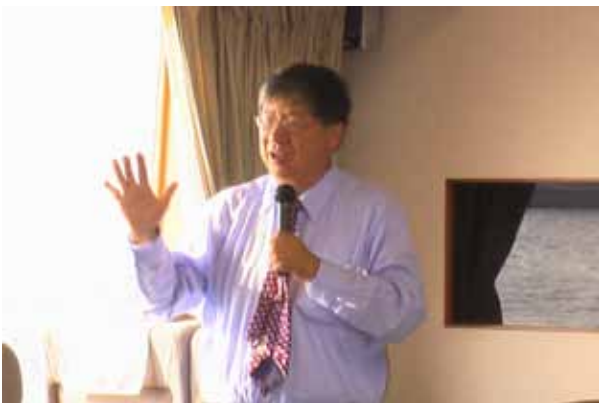
ドン総領事のあいさつ